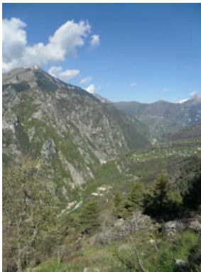
Circuit de Vignols 3h00 - moyenne