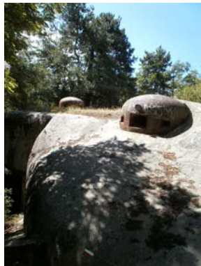
Fort de Flaut 3h00 - moyenne