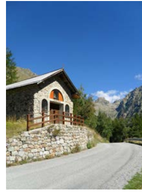
Saint Grat 3h00 - moyenne