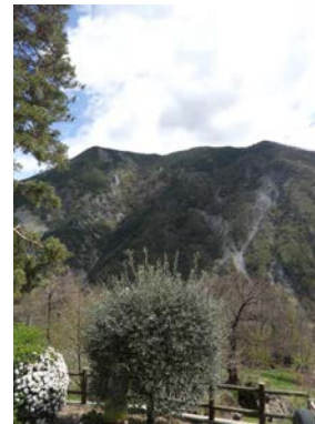
Circuit du Péla 5h00 - sportive