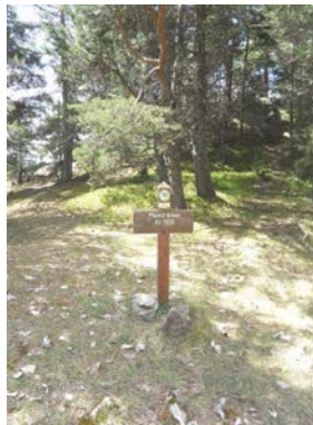
Place d'Armes 4h30 - sportive