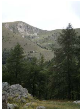
Cirque de Férisson 4h00 - moyenne