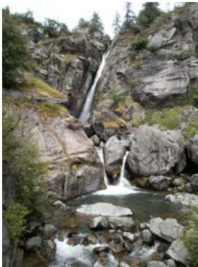
Les Terres Rouges 2h30- facile