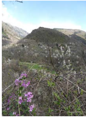
Circuit des Adrets 3h00 - moyenne