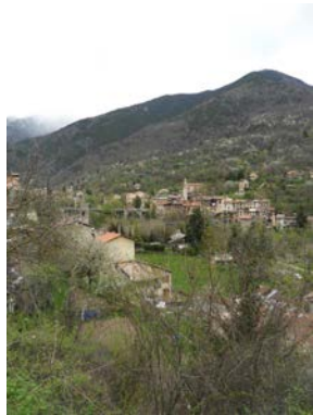
Roquebillière le Vieux 1h30 - facile