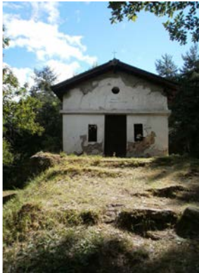
Le Planet 1h00 - facile