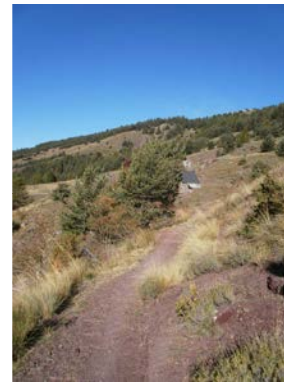
Circuit des Graus 4h00 - moyenne