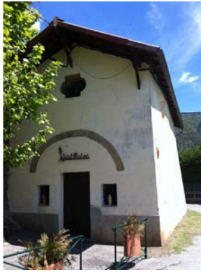
Circuit de Pranaous 1h00 - facile